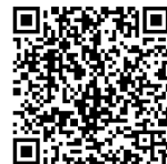
バスターミナル地図