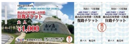
空港・港往復割引乗車券販売中