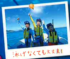
泳いなくても大丈夫!