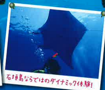
石垣島ならではのダイナミック体験!