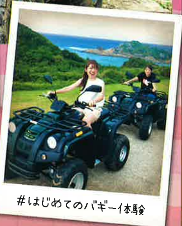
#はじめてのバギー体験