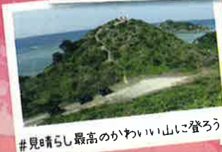
#見晴らし最高のかわいい山に登ろう!